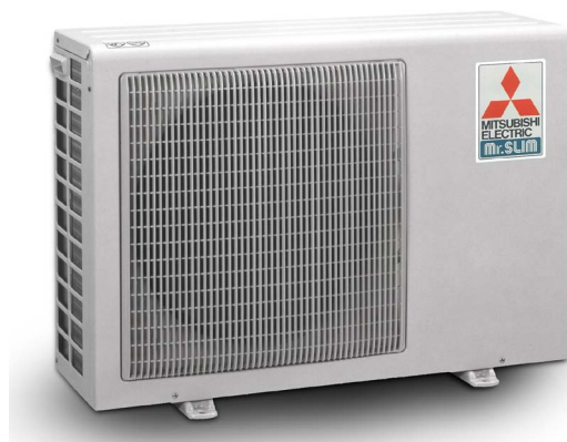
Utombusdel luft/vatten hybrid levereras från Mitsubishi tillverkad i grått chassi. Bör placeras ca 30-50 cm ovan mark.

Hybrid LV 10 kopplas mot Nordic Hybrid 500. Tanken är konstruerad för att jobba med flexibla systemlösningar som kan innehålla värmepump, solfångare och en vattenmantlad kamin/vedpanna. 500 liter skapar bra förutsättningar att lagra energi och långa gångtider.