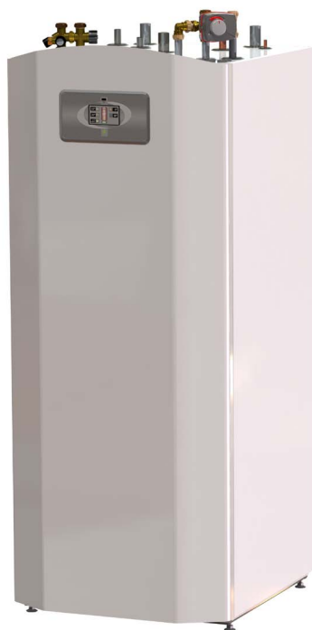
Utedel LV 14 kopplas mot Hybrid 500 som lätt kompletteras med energi från sol, ved eller pellets. En väldigt flexibel systemlösning.