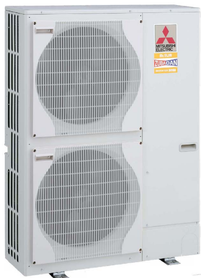
Utomhusdel luft/vatten SHW 112 från Mitsubishi tillverkad i grått chassi. En av marknadens bästa utedelar. Ger bra grundvärme i systemet.

Till Nordic Hybrid kopplas SHW 112 som är en av Mitsubishis absolut bästa LV värmepump. Den ger över 10 kW vid -15 och klarar därför att värme relativt stora hus. Bra och enkel grundvärme.