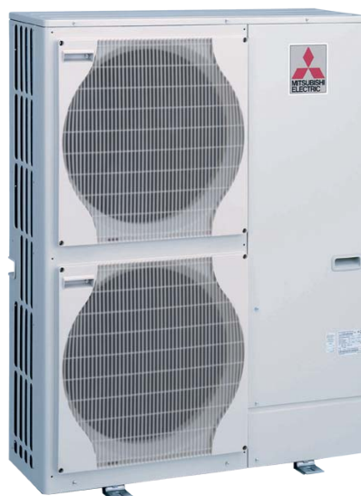
Utomhusdel luft/vatten hybrid levereras från Mitsubishi tillverkad i grått chassi. Bör placeras ca 30-50 cm ovan mark.

Till Nordic Hybrid kopplas SW 100 som är en stabil värmepump från Mitsubishi. Den ger ca 8 kW vid -15 och klarar därför att värme relativt stora hus. Bra och enkel grundvärme.